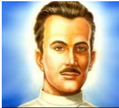
André Luiz (Esprit)

Il nous alerte sur la gravité du sujet, soulignant que chaque Maison Spirite, doit posséder son équipe de serviteurs de la désobsession, non pas seulement pour sa défense et sa conservation, mais aussi pour secourir les victimes de la désorientation spirituelle.