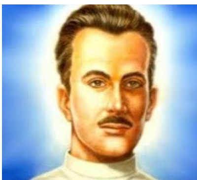
André Luiz (Esprit)

Il nous alerte sur la gravité du sujet, soulignant que chaque Maison Spirite, doit posséder son équipe de serviteurs de la désobsession, non pas seulement pour sa défense et sa conservation, mais aussi pour secourir les victimes de la désorientation spirituelle.